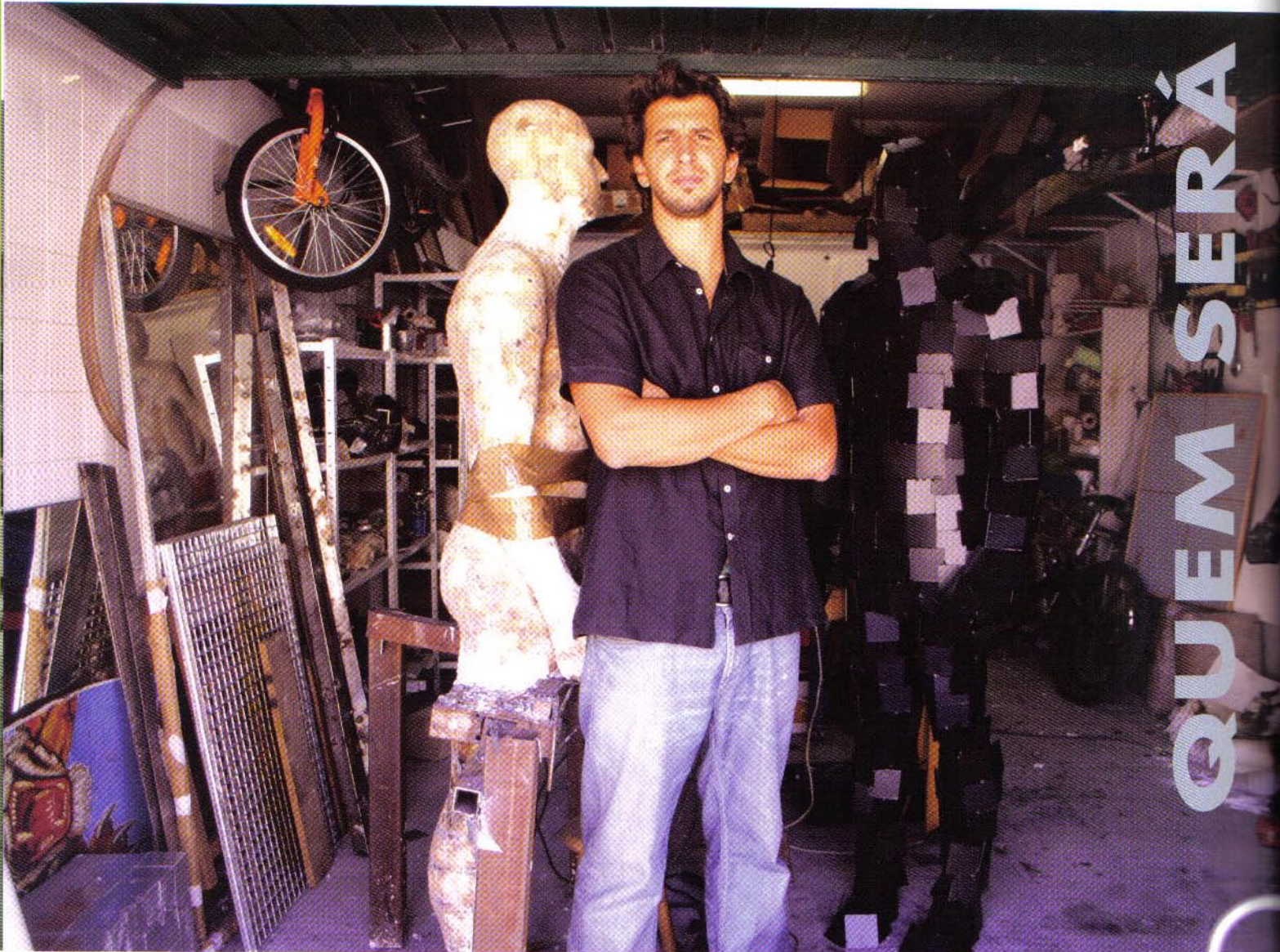
Vista do atelier